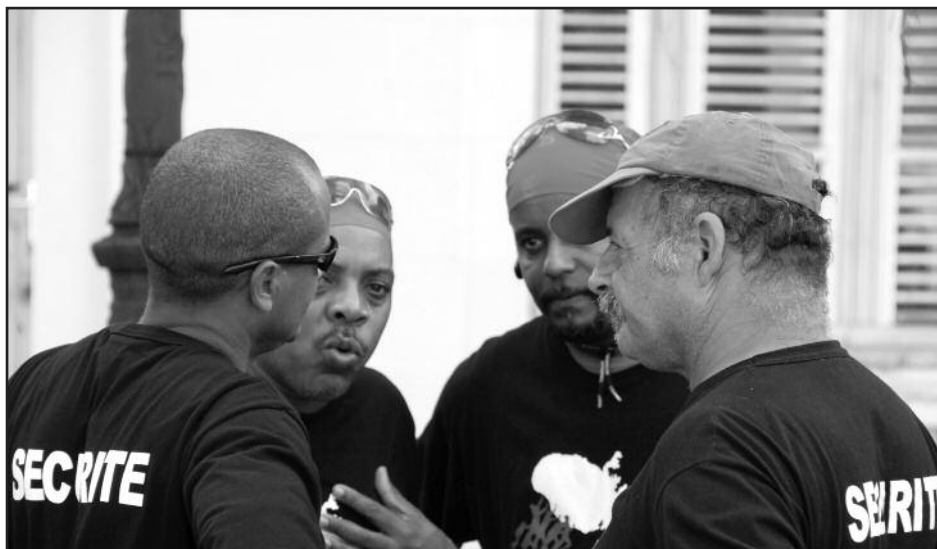
Le Collectif du 5 février s'est doté d'un service de sécurité

Des négociations sont prévues pour jeudi. Plusieurs marchés sont organisés pour permettre à la population de s'ap-