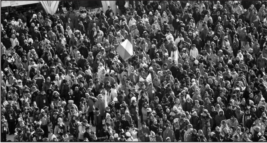
La majorité des Français ne pense pas que la Guadeloupe est un « poids pour la France »

L'organisme de sondage Opinionway a interrogé pour le Figaro Magazine séparément un échantillon de Français (1 002 personnes) et un échantillon de Guadeloupéens (402 personnes) du 21 au 23 février 2009 par téléphone sur les événements de Guadeloupe. Ses enseignements sont utiles pour les Martiniquais également.