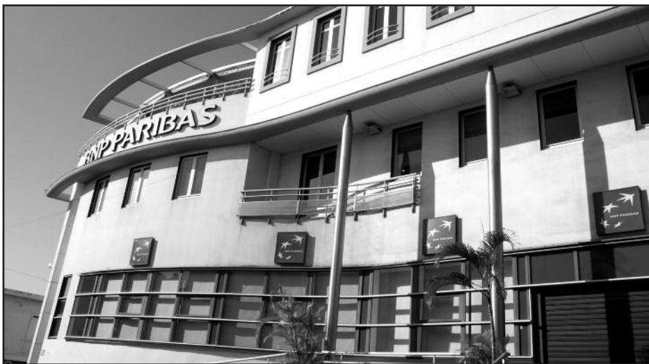
La forte hausse des défaillances d'entreprises en 2008, signe de la crise

Pour mesurer la santé financière des particuliers et des entreprises, l'Institut d'émission des DOM (IEDOM) calcule des indicateurs.