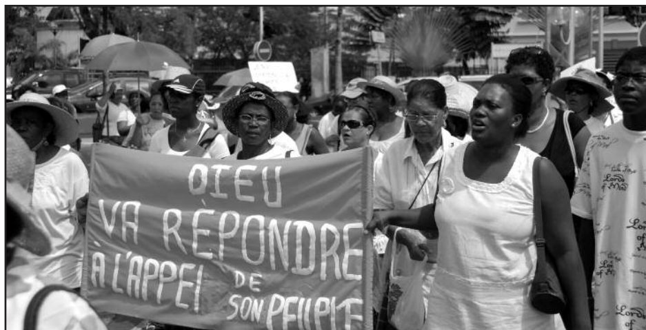
Chrétiens manifestant. Le peuple doit d'abord compter sur sa mobilisation pour vaincre

Les événements de ces dernières nuits ont-ils joué sur la reprise des négociations ? Le Collectif du 5 février a fait une première concession sur la revendication salariale en proposant 250 € au lieu de 354 €. L'intervention des élus