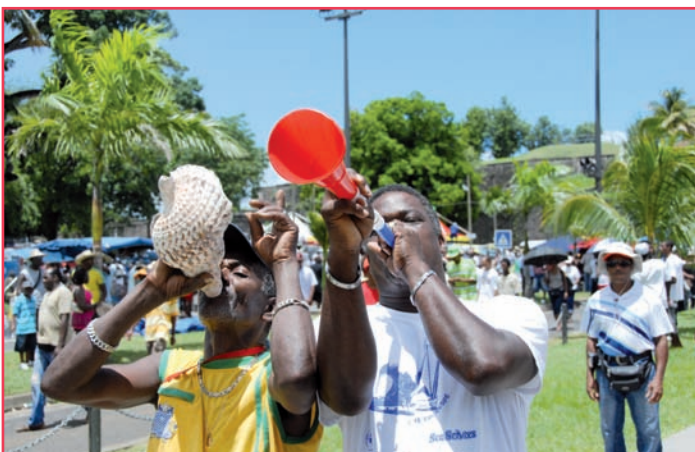
Quand la conque de lambi rencontre la vuvuzéla cela donne du bruit!