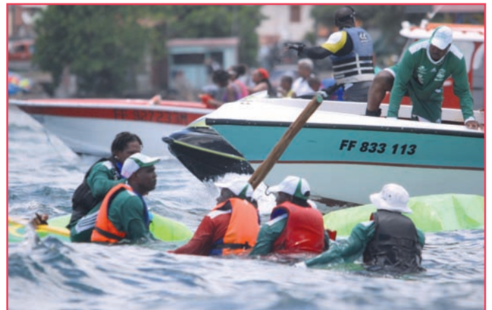
Premier bain, première infortune