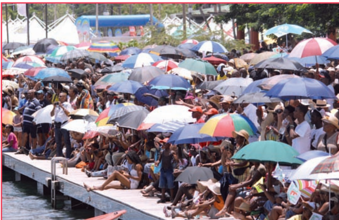
Des milliers de passionnés sous un chaud soleil