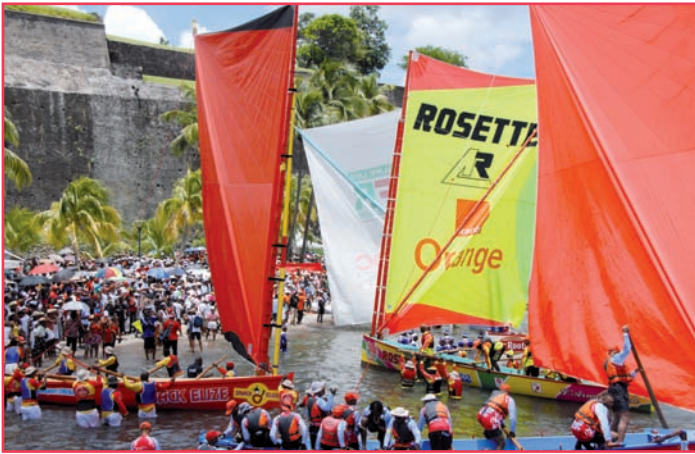
Une explosion de couleurs unique