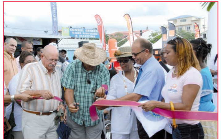
Le tour, l'occasion de faire passer des messages forts, ici le Salon Handicap