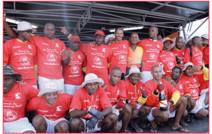
Brasserie Lorraine, premier maillot rouge